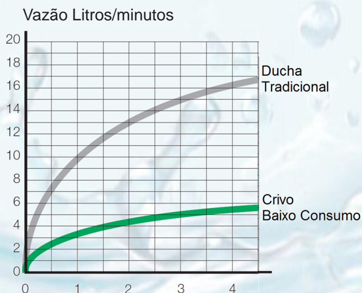
Gráfico Diagrama de Fluxo

Economia de 600 litros de água em 1 hora.